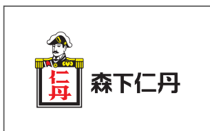
森下仁丹株式会社