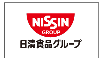
日清食品グループ