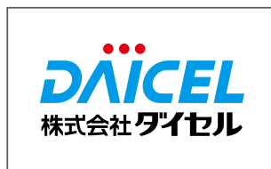
株式会社ダイセル