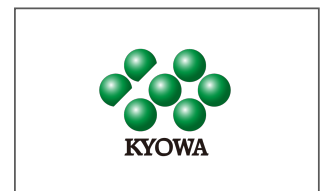
協和発酵バイオ株式会社