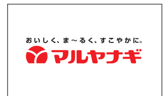
株式会社マルヤナギ小倉屋