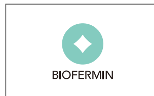
ビオフェルミン製薬株式会社