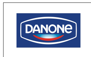
ダノンジャパン株式会社