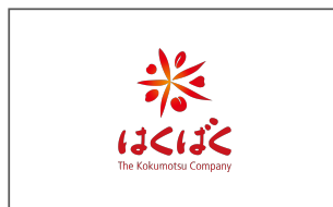
株式会社はくばく