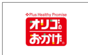
塩水港精糖株式会社