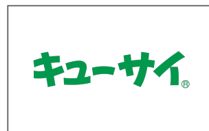
キューサイ株式会社